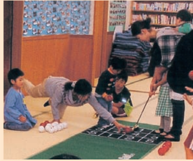
福祉のまちづくり支援事業 (3世代交流・健康づくり活動機器整備) ●一戸町 川原田町内会

誰でも気軽に使える輪投げなどを購入し、世代間交流と元気な地域づくり、人づくりに活用しています。