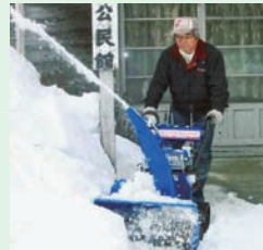
安全・安心の地域づくり支援事業 (除雪支援活動) ●金ヶ崎町 二日町自治会

除雪機の整備で高齢者世帯や通学路の除雪など、地域の安全・安心に役立っています。高齢者世帯の方々からも大変感謝されています。