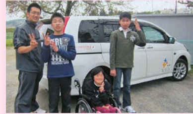
施設整備費 ●一関市 (特非) 響生 施設名 リトル・ピース

学校への送迎は、時間により個人車対応が必要で、不便を感じていました。車補助成により多くの子どもたちの送迎が可能となり、利用者一同喜んでます。