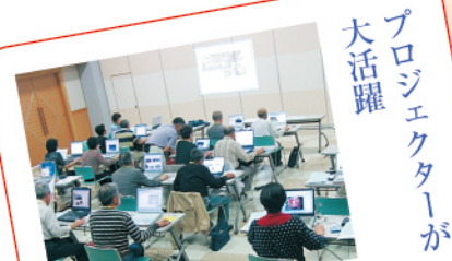
プロジェクトが大活躍 福祉のまちづくり支援事業 公民館でパソコン教室を開催し、障がい者や高齢者の方々に指導しています。