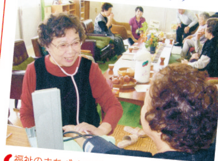
福祉のまちづくり支援事業 血圧計などの機器を整備したことで、みんな進んで健康チェックを行っています。