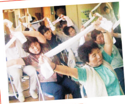
福祉のまちづくり支援事業 パイプ椅子を整備したおかげで、参加者が2倍に増えました。