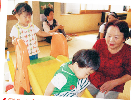
福祉のまちづくり支援事業 子育て中のお母さん同士の交流を応援したり、子育ての悩み相談にも応じています。