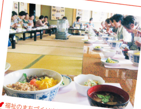
福祉のまちづくり支援事業 一人暮らしの高齢者の「はつらつ」食事を地域のボランティアの皆さんが、一人暮らし高齢者の方々に給食サービスを実施しています。