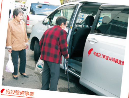
施設整備事業 健康教室「はつらつクラブ」へ出発。介護予防と楽しい交流で、元気な笑顔がひろがります。