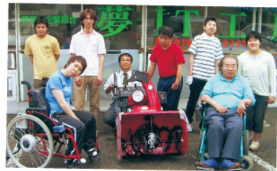
施設整備事業 これで雪かきもスムーズ。車いすを使用する方も安心です。