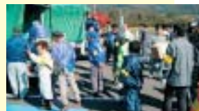
「新潟県中越地震」災害の際、被災地に向けて救援物資の積み込み作業(ふれあいランド岩手)

風水害や地震の場合、災害ボランティアが救援活動に参加し、被災地の復興に大きな力を発揮しています。こうした災害ボランティア活動や、支援・救援活動を円滑にする活動拠点(災害ボランティアセンターなど)の経費にも役立てられます